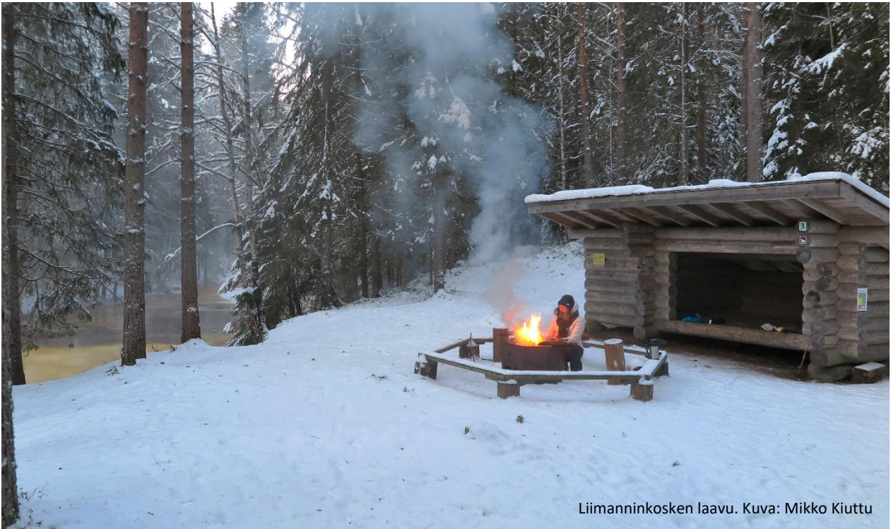
Liimanninkosken laavu.

Liimanninkosken lehtojensuojelualueella Muhoksella on noin kilometrin mittainen helppokulkuinen luontopolku tunnelmallisessa talvisessa metsässä. Liimanninkoski on osa Muhosjokea, joka on uurtanut uomaansa tuhansien vuosien ajan yhä syvemmälle hiekkaiseen maaperään muodostaen kauniin koskimaiseman tuuheiden metsien ja rehevien lehtojen keskelle. Liimanninkosken luontopolku alkaa Suonkyläntien varressa sijaitsevalta pysäköintialueelta, jonne on opastus Valtatie 22:n varresta. Luontopolun varrella, aivan kosken partaalla on laavu, jossa voi hengähtää ja nauttia eväitä.