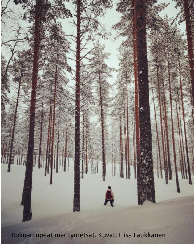
Rokuan upeat mäntymetsät.